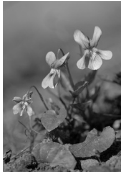
Violetje (© Jeroen Mentens)