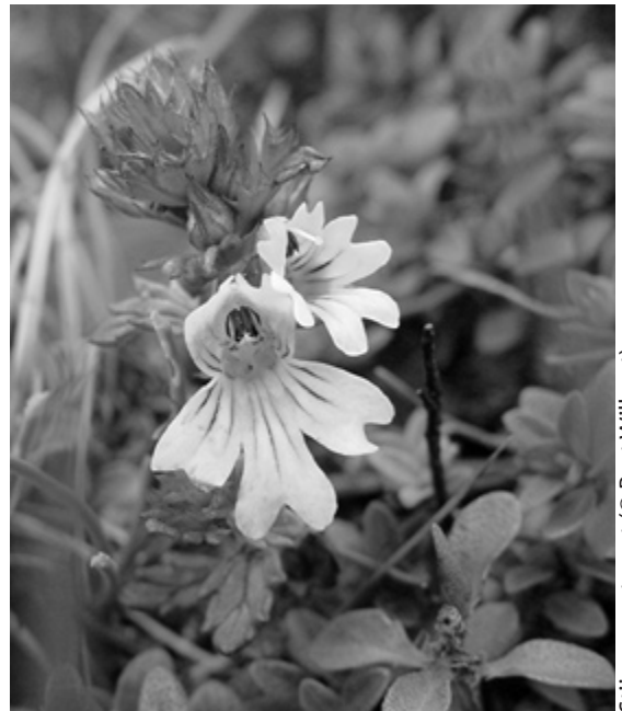
Stijve ogentroost

Is er dan niets van overgebleven, echt niets? Zoals dat bij de natuur wel eens meer het geval is, heeft ze zich heel beperkt dapper stand weten te houden omdat net dat ene stukje grond een ander gebruik kreeg toegewezen. Zo een gebied is het Vloethemveld, een militair domein dat op zijn minst een monument en botanische schatkamer mag genoemd worden.