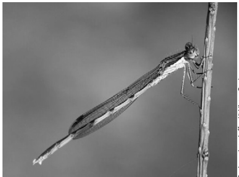
Bruine winterjuffer

De Volharding, eigendom van de afdeling Bos en Groen van de Vlaamse Gemeenschap, bestaat vooral uit een aantal oude kleiputten. Er tussen vindt men restanten van natte heide en struwelen met berk, wilg en zomereik. Deze