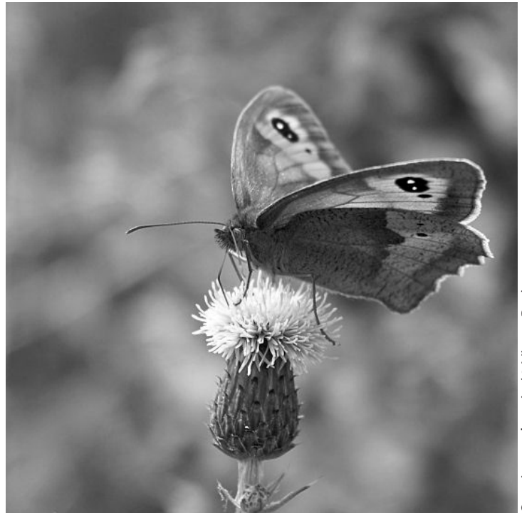
Oranje zanddoogje

het uitgestorven was in Vlaanderen. Gelukkig kunnen nog enkele populaties standhouden, waarvan twee in West-Vlaanderen: één in een duingrasland aan de Westkust, en één in een heiderelictgebiedje nabij Brugge.