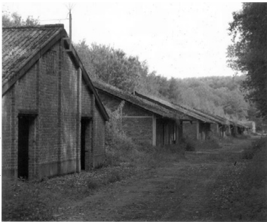
Uit Desmedt A, Vanhevel A, Kiss M. Het Vloethemveld

Behalve de plantengroepen van zoute milieu's zijn binnen het militair domein alle socio-ecologische groepen vertegenwoordigd. De 373 gedetermineerde plantensoorten komen overeen met 37 procent van het totaal aan plantensoorten in Vlaanderen.