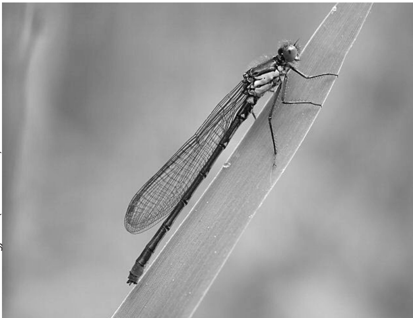
Grote roodoogjuffer

zonder kleine landschapselementen. Door de ruilverkaveling is de Mark gekanaliseerd vanaf de grens van de deelgemeenten Minderhout en Meer, wat drastische gevolgen heeft gehad voor de omgeving. Niet enkel de meanders met hun typische libellenfauna gingen verloren, ook de permanent water houdende grachten tussen de beemden. Deze vormden zeer interessante milieus (gebufferd water) waarin onder ander de Dwergjuffer voorkwam tot begin jaren '70. Ongetwijfeld heeft ook de zeer slechte waterkwaliteit van de jaren 80 een grote invloed gehad op de