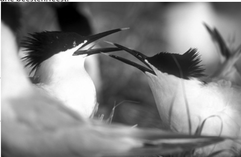
Grote stern