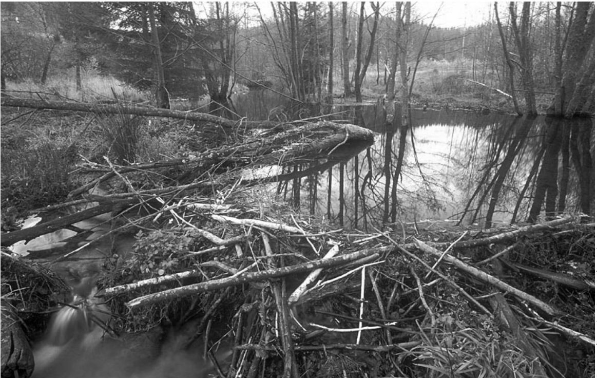
Beverdam