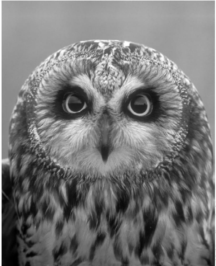
Velduil