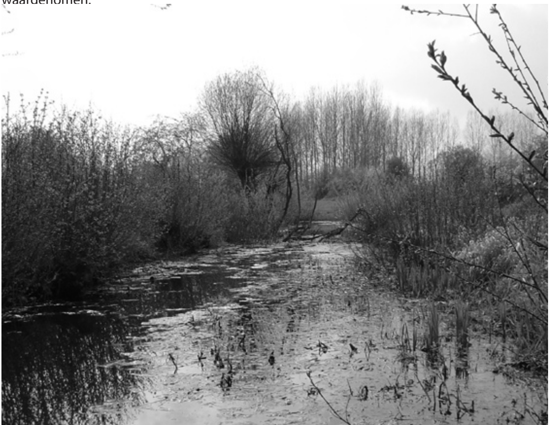
Poel in het natuurservaat Viskot, hier lijkt de Kamsalamander nog goed te gedijen.

Voornamelijk het voorkomen van Kamsalamander verdient onze aandacht. Deze soort is opgenomen in Bijlage II van de Habitatrichtlijn en geniet dus bescherming op Europees vlak (zie verder). Bijna in alle