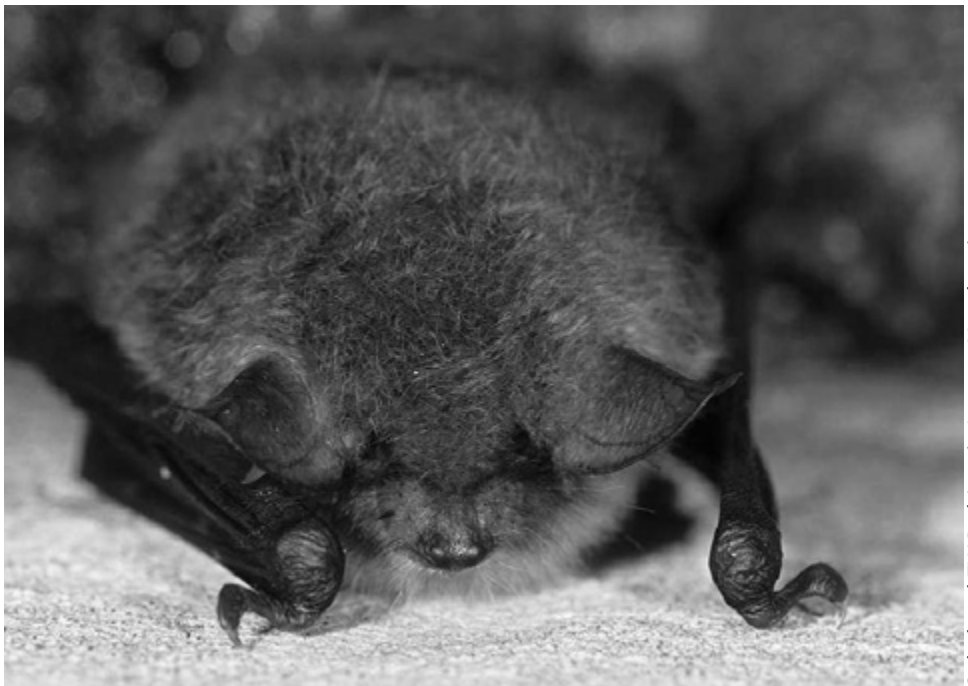
Onbekend ZWG-object

De winnaar krijgt zijn of haar cadeaubon thuis opgestuurd.