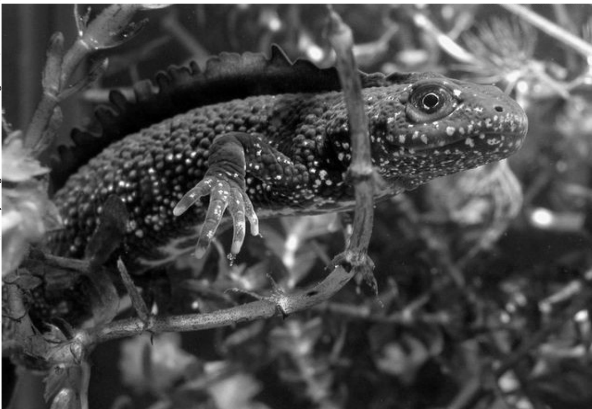
Kamsalamander ( Triturus cristatus ), de tijd begint stilaan te dringen...

Oude Spoorweg te Neerlinter. Telkens betrof het minder dan vijf individuen, in tegenstelling tot 2003 toen tijdens een avondexcursie van JNM Oost-Brabant maar liefst vijftien volwassen individuen werden aangetroffen in het Viskot (I. Lewylle, pers. med.). Daarnaast werd in 2004 een vrouwtje Kamsalamander aangetroffen in het Doysbroek (K. Lambeets, pers. med.). Zowel de recent uitgediepte poel in het Doysbroek als deze in het Viskot blijken droog te vallen tijdens de zomermaanden. In het gebied Meertsheuvel, gelegen in het interfluvium van Grote en Kleine Gete, tussen Zoutleeuw en Budingen, werd de soort na inrichtingswerken in meerdere poelen aangetroffen (geg. M. Boyen & L. Briesen). Hier werd in het kader van Ruilverkaveling Melkwezer een beschermingsplan voor Kamsalamander uitgewerkt (Vander Elst, 1997). Concluderend kunnen we stellen dat de soort nog steeds aanwezig is in de Grote Getevallei, doch de vindplaatsen zich op enige afstand van elkaar bevinden. Een gerichte en